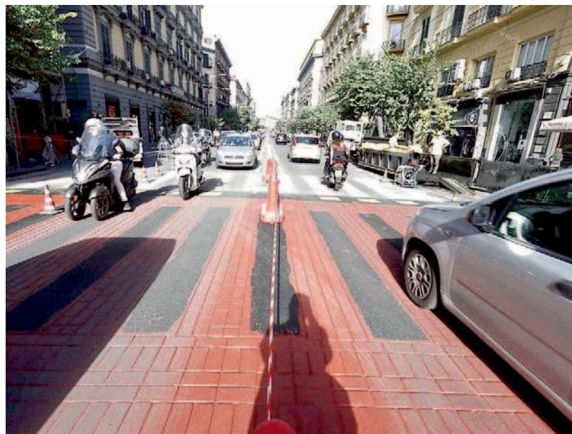
Uno dei dossi voluti dal Comune per ridurre la velocità in corso Umberto